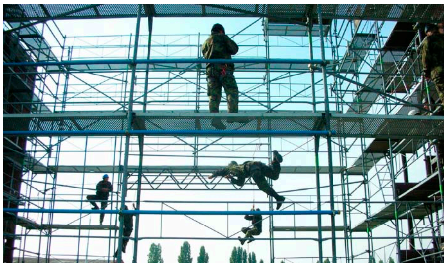
Součástí základního výcviku je i překonávání terénních či stavebních překážek

V čem naši záložníci spatřují hlavní nevýhody služby? Shrňme je do tří ka-