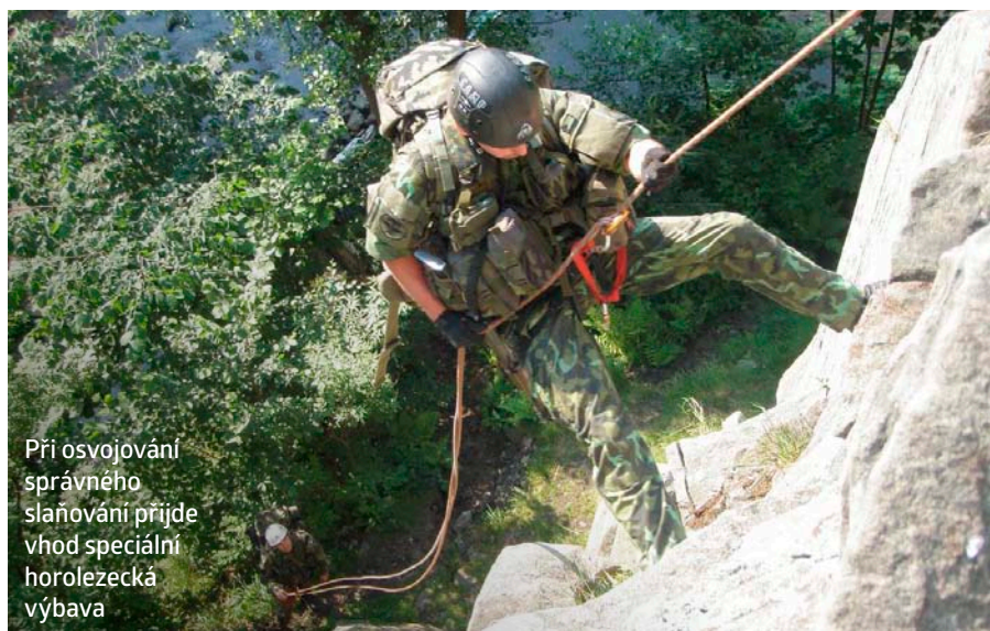
Při osvojování správného slaňování přijde vhod speciální horolezecká výbava

Zmíněná kvalita výzbroje a výstroje AZ je dlouhodobě velké téma. Vzhledem k podfinancované AČR směřuje většina prostředků k profesionálům a na záložáky zůstávají spíše „drobky“. Tento problém uznávají i vysocí důstojníci a budiž armádě ke cti, že se snaží situaci řešit. Zatímco někteří muži a ženy z AZ považují pomalejší dodávky lepšího vybavení