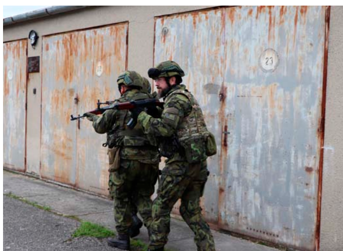
... nebo si vyzkoušeli taktiky CQB (Close Quarters Battle čili boj v uzavřených prostorách)