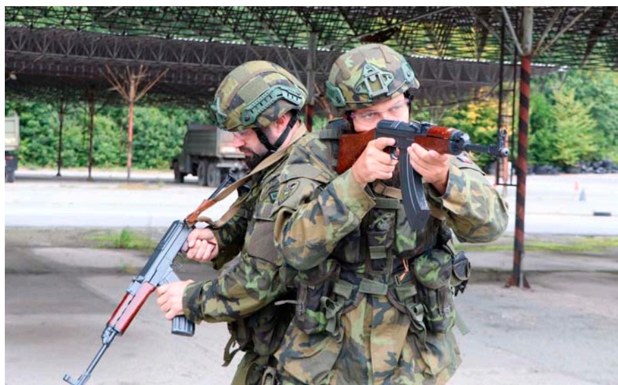
Zatímco balistické přilby už bývají u AZ samozřejmostí, mnoho jednotek stále používá zastaralé samopaly vz. 58

z nichž většina zůstala v anonymitě. I díky tomu jsem se dočkal otevřených a upřímných odpovědí.