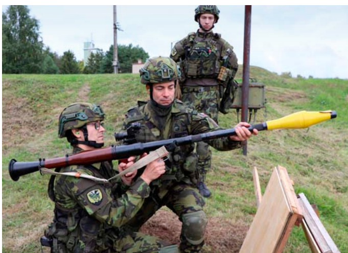
Při cvičení Libavá 2021 si brněnští záložníci mimo jiné zastříleli z RPG...

Ukazuje se, že největší zájem bývá o posádky v okolí bydliště dobrovolníka. Například na jižní Moravě tento trend posilují i útvary s obzvláště zajímavým uplatněním. Hodně mužů a žen tak usiluje o místa u 74. lehkého motorizovaného praporu, populární je také služba u elitních jednotek v čele s těmi prostějovskými (601. skupina speciálních sil i 102. průzkumný prapor). Tam však zájemci musejí nejprve absolvovat výběrové řízení, které zahrnuje psychotesty a prověrku fyzické zdatnosti. Základní úkol rezervistů spočívá v dočasném navýše-