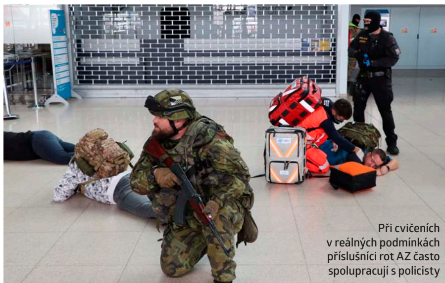
Při cvičeních v reálných podmínkách příslušníci rot AZ často spolupracují s policisty

Přelom nastal v roce 2016, kdy nový branný zákon výrazně zlepšil podmínky služby v AZ včetně odměňování. Tím se prolomily ledy u mnoha váhajících, zároveň AČR přistoupila k rozsáhlé pro-