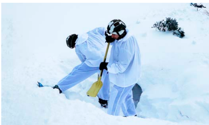
... i budování nouzového přístřešku pod sněhem v Jeseníkách

tegorií: dohady se zaměstnavatelem, chybějící vybavení a jistá nepružnost armády při plánování cvičení a nasazení AZ. Přestože AČR nabízí firmám kompenzace za dobu, kdy je zaměstnanec na cvičení, skloubení práce a služby je stále problémem číslo jedna.